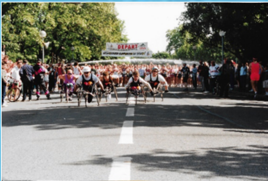
Le départ d'une course handisport

Le Conseil de l'Europe a été créé le 5 mai 1949. En 1999, il fêtait son 50e anniversaire. En accord avec la Ville de Strasbourg et la Ville de Kehl, le parcours a été modifié avec un départ devant le Conseil de l'Europe et un passage symbolique vers Kehl via le Pont de l'Europe pour le semi-marathon. La remise des dossards se faisait dans les locaux de l'ancien Palais des Droits de l'Homme.