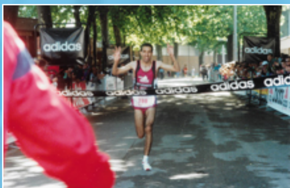
Une arrivée au WACKEN

1989 fut l'année de la dernière édition du Marathon de Strasbourg pendant les courses.