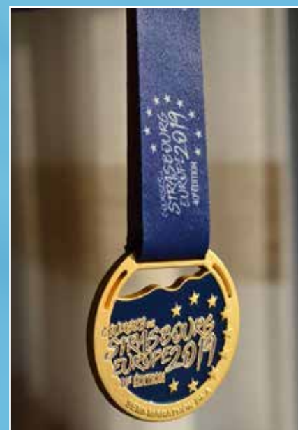
La médaille FINISHER du semi-marathon fait son retour en 2019

En 2019, la participation féminine de 44% confirme l'engouement des femmes pour la course à pied.