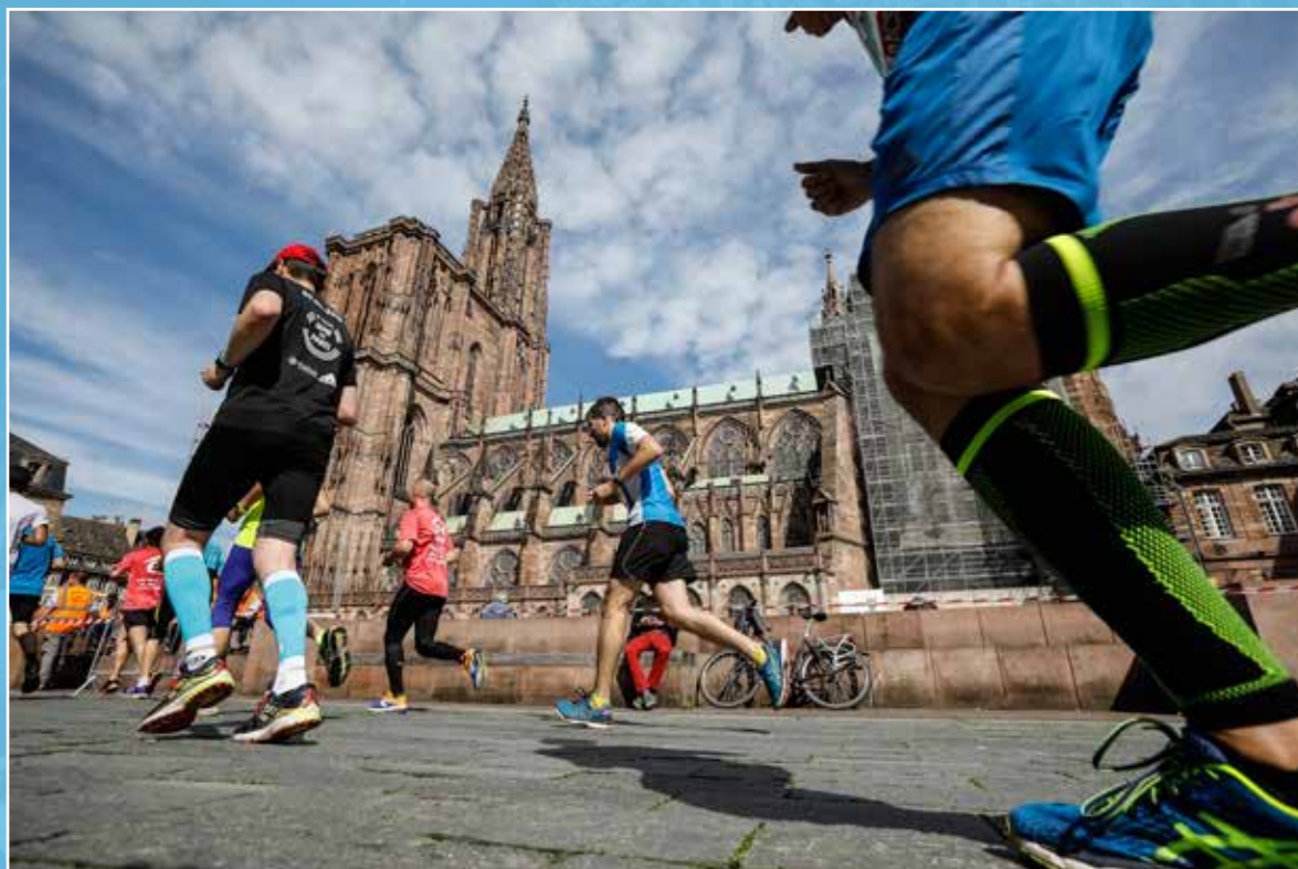
Traversée de la Place du Château au pied de la Cathédrale

La manifestation est possible grâce à l'association de bénévoles issus des clubs membres de l'ODS et d'une équipe de salariés.