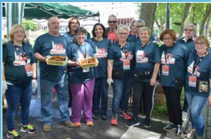
Les bénévoles du ravitaillement arrivées