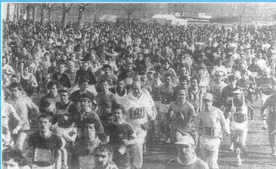
Le départ de la Course en 1980

L'engouement était tellement fort que des centaines de coureurs ont reconnu le parcours pour s'entraîner et relever le défi. Le mouvement sportif strasbourgeois n'avait jamais connu une telle ferveur pour participer à ces épreuves et obtenir la médaille à l'arrivée, témoignant de leur réussite.