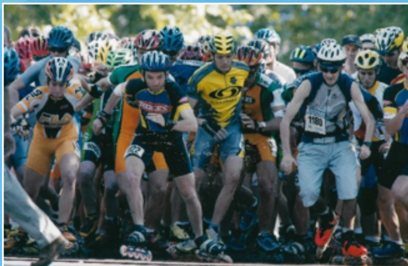
Le départ de la course des rollers