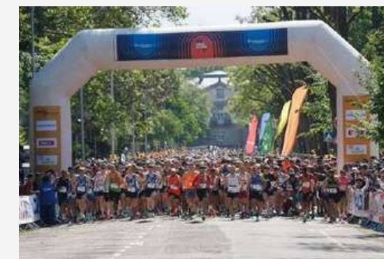
Départ des courses Rue de l'Université