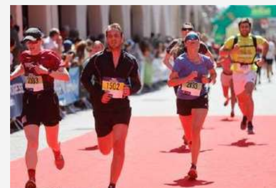
Arrivée des courses Rue des Grandes Arcades